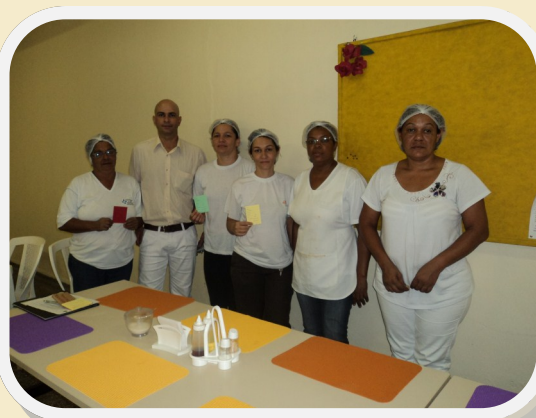
Equipe exibe etiquetas coloridas

A equipe de colaboradores da Unidade de Alimentação e Nutrição, UAN, do Hospital Regional de Rondonópolis Irmã Elza Giovanella – São Camilo – recebeu um treinamento especial para praticar o novo projeto iniciado no setor que visa reduzir a perda de alimentos em estoque.