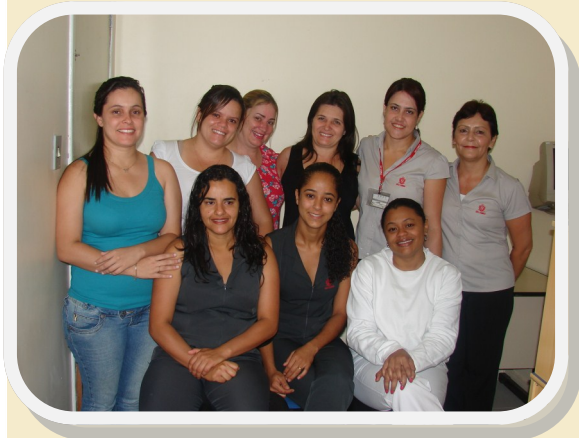
Nova CIPA 2012 eleita

Aconteceu no Hospital São Vicente de Paulo – São Camilo – a posse da Comissão Interna de Prevenção de Acidentes, CIPA, para a gestão 2012, composta por profissionais de diversos setores do hospital. A nova CIPA dará continuidade ao bom trabalho desenvolvido pela antiga Comissão que envolvia capacitações, cursos e dinâmicas em grupo a fim de chamar a atenção de cada colaborador do seu papel preventivo.