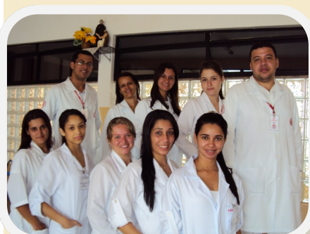
Novos estagiários no HNSC

Pensando na importância de diferentes vivências para a formação profissional, o Hospital Nossa Senhora do Carmo – São Camilo - abre espaço para instituições de ensino utilizarem o Hospital como campo de prática assistencial no estágio profissional que, em troca, contribuem com informações atuais do ambiente acadêmico aos profissionais do HNSC.