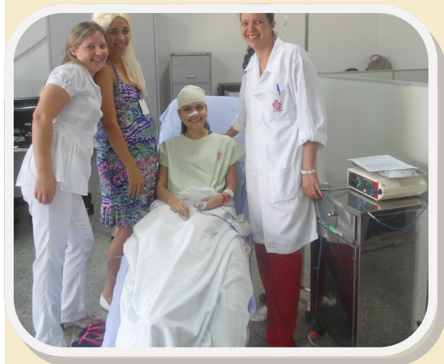
Momentos da capacitação que enfatizou a humanização hospitalar

Durante a primeira Educação Continuada do ano de 2012, o Hospital Coração de Jesus – São Camilo – discutiu a importância da organização dos setores e da humanização hospitalar para elevar a qualidade no atendimento do Hospital. Uma das palestras se baseou no Programa 5S que tem o objetivo de favorecer a produtividade da instituição por meio de um planejamento sistemático que envolve ordem, limpeza, segurança, clima organizacional e motivação dos colaboradores. Uma das metodologias prevê a separação do que é e não é necessário em determinado setor.