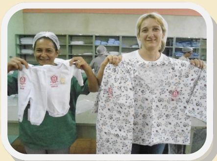
Roupas personalizadas com emblema camiliano

Foram adquiridos um total de 630 peças, de início. Entre elas são 200 unidades de pijama infantil, 400 camisolas e 30 conjuntos de body infantil.