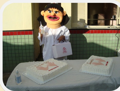
Acima, dinâmicas sobre higienização e abaixo, mascote do HMVB contra Infecção