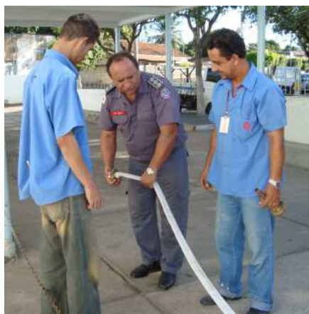
A Vistoria faz parte de uma rotina do Corpo de bombeiros.

O Hospital São José e São Camilo recebeu a visita de integrantes do Corpo de Bombeiros com o objetivo de vistoriar o Projeto de Pânico e Incêndio implantado no Hospital com o intuito de oferecer maior segurança aos colaboradores e usuários da entidade.