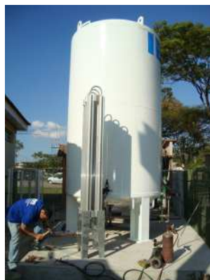
A manutenção será preventiva mensalmente.

Com o objetivo de oferecer mais segurança, conforto e melhores condições de internação aos seus usuários, o Hospital e Maternidade Vital Brazil realizou na semana passada a instalação de um tanque de oxigênio na maternidade para ampliar a distribuição do oxigênio.