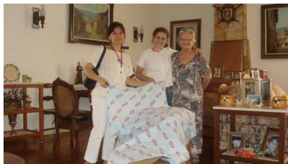
O HSVP recebeu 64 lençóis e 118 fronhas da voluntária

O Dia Nacional de Luta dos Portadores de Deficiência