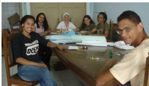
Integrantes da Diversidade confeccionando cartões

foi comemorado ontem, 21. A data é lembrada por entidades que lidam diariamente e se preocupam com o papel social de inserção dos deficientes.