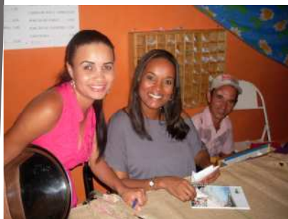
Voluntários do HSM em trabalho no evento beneficente.