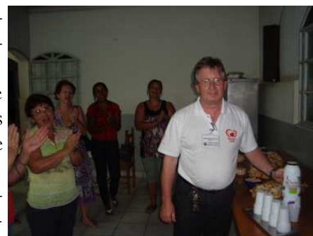
Agentes da Pastoral em comemoração

O Grupo também realiza visitas domiciliares aos enfermos da comunidade local. Atualmente a Pastoral é composta por 57 membros que desenvolvem trabalho voluntários de assistência social.